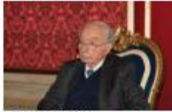
GIULIANO AMATO J.