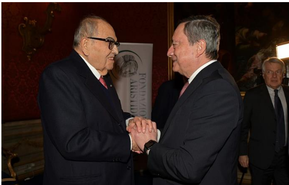
Francesco Merloni e Mario Draghi