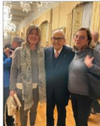
Da sin. Nunzia Eleuteri (ad di Crànache Ferrarese e Radio FM1), Francesco Merloni e Antonella Malaspina

Il libro racconta questa storia attraverso la lente della passione politica e sociale di Francesco Merloni: sette legislature, dal 1972 al 2001, come parlamentare della Dc e poi dell'Ulivo, le battaglie contro gli sprechi delle Partecipazioni statali, la fine della Dc, la nascita del Partito popolare e poi dell'Ulivo, compresa la parentesi come Ministro dei Lavori Pubblici (1992-94) nei Governi Amato e Ciampi e la burrascosa approvazione della prima legge organica di riforma degli appalti, dopo gli scandali di Tangentopoli, che porta il suo nome.