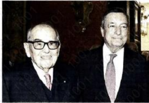
Francesco Merloni con Mario Draghi