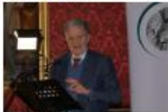
ROMANO PRODI 1