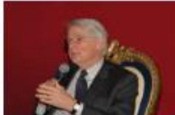
FERRUCCIO DE BORTOLI