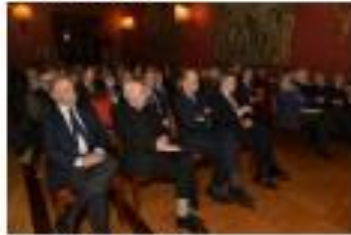
ENRICO LETTA MARIO DRAGHI ROMANO PRODE