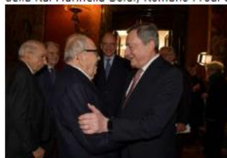
MARIO DRAGHI FRANCESCO MERLONI ENRICO LETTA GIULIANO AMATO ROMANO PRODI

"Sono qui per dire grazie a tutti, e voglio ricordare tante persone. Grazie di essere qui in un clima di intima e profonda amicizia. Grazie in particolare a Mario Draghi per la sorpresa che ci ha riservato. È un grande onore avervi qui, Mario, insieme a tutti noi", ha detto Francesco Merloni, presidente della Fondazione Aristide Merloni, prima che scattasse un applauso in sala.