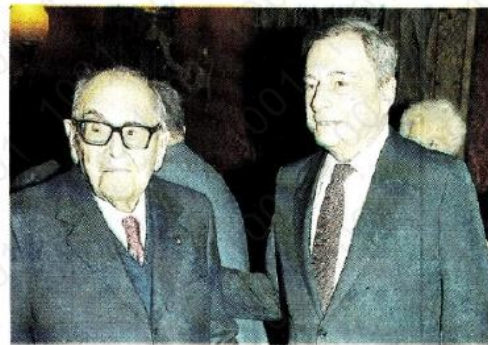
Sopra, da sinistra, Francesco Merloni con Mario Draghi. Sotto, da sinistra, Romano Prodi con Giuliano Amato