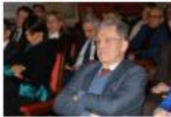
ROMANO PRODI 2