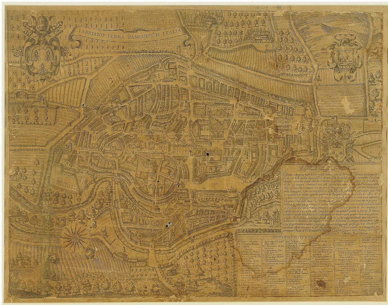
2 Michele Buti, Fabriano Terra Famosiss(ima) D'Italia , incisione di Matthaeus Greuter (1566 ca - 1638), Roma, 1630, 405x522 mm, Fabriano, Archivio Camillo Ranelli.

te legittimate da una funzione vicaria del papa in temporalibus . Questa consapevolezza pragmatica portò a definire una strategia di azione, discussa nelle sedi istituzionali nei giorni critici della rivolta e della minaccia militare pontificia. Essa autorizzò una resistenza militare solo per difendere la città da un nuovo temuto saccheggio, ma ribadì, almeno nelle enunciazioni formali, la fedeltà alla sovranità pontificia. La vittoria che le truppe fabrianesi ottennero sui pontifici diventò, alla fine, lo strumento politico necessario per intavolare una trattativa capace di garantire la conservazione di alcune prerogative locali, nel quadro di una appartenenza regolamentata allo Stato ecclesiastico, che stava cercando di restringere anche con l'uso della forza le maglie della sua organizzazione politica.