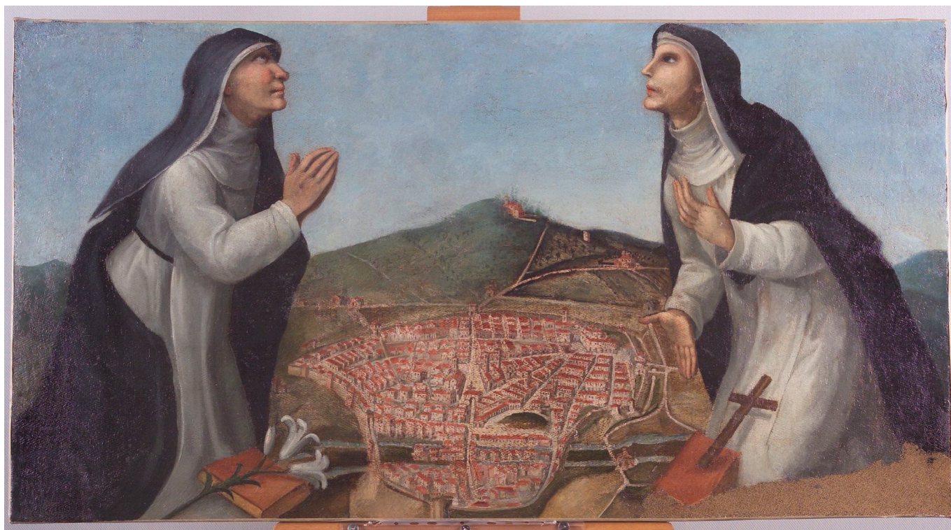
1 Domiziano Domiziani (Fabriano, 1530 ca–1610), Le beate Bianca e Rufina in preghiera e ringraziamento per la vittoria di Fabriano contro le truppe di Leone X , dipinto su tela, fine sec. XVI, 83x118 cm, Fabriano, Pinacoteca Civica Bruno Molajoli.

i conflitti attivati tra le sue componenti, che il paradigma di de Certeau era più capace di identificare.